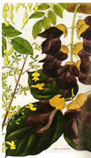
図 1: 北村四郎・村田源共著 保育社『原色日本植物図鑑木本編 [1]』1971 年所収、図版 70-433 のトビカズラ

り、当時は田川先生のシダの植木鉢が沢山並んでいた。昭和 22 (1947)年頃の卒業実験では、その奥にある部屋を私と同期生の仙波君が使わせて貰った。教室から向かい側にあった地質館物の建物に沿って右折し、農学部の方に向かうと左側に大きな温室があった。それは植物学教室の施設であったが、既に燃料がなく、手入れもされず熱帯・亜熱帯植物は殆ど枯れていた。そこに唯一種だけ逞しく生きていた常緑ツル植物があった。今考えると南西諸島以南の産ミツバビンボウヅルだったと思う。どういう訳か大変印象深いので、その後入手して我が家の庭に育ち、冬にはいくらか傷むが、戸外で育っている。