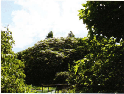
写真：開花中のユクノキとメタセコイア