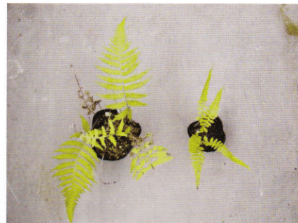
写真 1: ナチシケシダの葉型変異の例。どちらも胞子葉をつけた成熟個体。

はじめに植物園の入口からは奥にある新しい温室での話をしましょう。私が京都大学理学研究科の大学院に入学してまず利用したのが、この新しいほうの大型温室でした。大学院に入学当初の私はナチシケシダというシダ植物の染色体数と形態形質との関係に興味をもっていました。分類学の世界では、しばしばよくわからない個体をまとめておく「ゴミ箱」的な分類群が存在します。ナチシケシダはまさに「ゴミ箱」的な種でした。そのため葉の形質に変異が大きく、その中には複数の生物学的種が含まれている可能性があったのです(写真 1)。