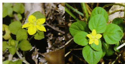
写真 2: ヒメコナスビ (左) とコナスビ (右)。スケールがはいついていないが、ヒメコナスビとコナスビの花の大きさはほぼ同じである。そのためヒメコナスビのほうが葉が小さいことがわかる。

次はボロの温室でおこなった研究の話をしてしましよう。大学院を卒業した私は屋久島の高山性ミニチュア植物に興味をもちました。屋久島の高山性ミニチュア植物は祖先種から分化してからの時間が短く、元となった祖先種も現存しているため適応進化の研究材料として優れていると思ったからです。屋久島の高山性ミニチュア植物の中から、集団数が多く、世代時間が短いヒメコナスビを用いて、祖先種であるコナスビと比較することにしました (写真2)。