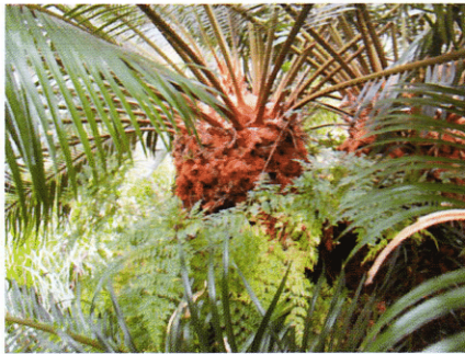
写真3: タイワンソテツ

これら、シュロについては1973年の目録にも、シュロ（「池田より」とあり、池田は大阪の北部にあり植木屋が多い地域）と出ている。とすると、苗を購入、植栽したのであろう。なお今の技術なら、地面近くの組織の一部を測れば年齢も解ると思う。