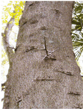
写真2：トウサイカチの幹に生える刺

想わせる場所があり、畠山先生 22 による生態学実習で微細気象（局所的な温度や湿度測定）を習ったりした。その場所は日当たりも良く、ハマエンドウやハマゴウが拡がって綺麗な花をつけ、ハマナツメの小木があつて独楽を思わせる形の果実を付けているのが印象に残っている。ハマナツメは三木先生が鹿児島から持ってきたものとの記録がある。そして「鹿児島産のものを京都に植えると、段々早く花がさいて実ができるようになってくる。」と述べている（生物学閑話 第II集）。私も暖地や四季が逆の南半球から持ち込んだ植物が段々と植えた土地に慣れてくると思う経験が少なくない。しかし今では、記憶していた海岸砂丘を想わせる場所は全く判らず、現在ヒイラギモチ (map-i) が生い茂っている辺りかと記憶する。海岸性の種類のハマエンドウ・ハマゴウ・ハマナツメなどはほかの植物に圧されて既にその影も形も見えなかった。