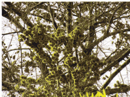
写真1：イヌカラマツの毬果

入り口近くには短冊状のコンクリート水槽に絶えず水が流れ、実験用の水生植物オオカナダモが他の種類を圧倒して育っていたが、それもまた影も形もない。