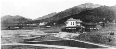
写真 4:「建設中の理学部附属植物園より東北方比叡山方面をのぞむ」、京都大学農学部創設当時(大正 12 年(1923)頃)の写真(『生物学閑話 一郡場寛博士との対談一』第 II 集、廣川書店、昭和 41 (1966) 年、p. 22)

その昔、京都では鴨川を隔てた東は平地から東山にかけて点々と寺社多く、刑場もあり、祇園の社の下に町からは外れた廓もあったという。山麓一帯のほかの土地は田畑だった。要するにそこはもう、町からは鴨川で仕切られた田舎だったのである。