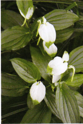
写真：開花中のハンゲシヨウ

の認識」とは、また別の次元のことだと思っています。それが心配と言えそうなのですが、……。ともかく、また改めて明日お書きします。