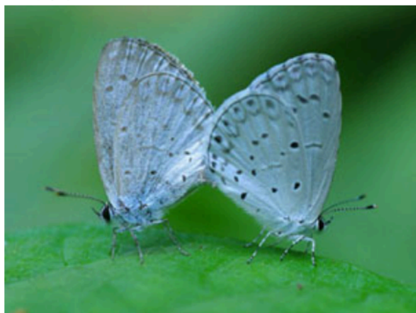
▲写真2:ヤマトシジミ

写真1はアカタテハ。全国に分布する普通種で、花に吸蜜に訪れるほか、クヌギの樹液などにも集まるので、クワガタ採りに行くとよく出会う蝶である。雌雄で羽の模様に違いがなくて区別は難しいが、この写真の個体は産卵中であることからメスと分かる