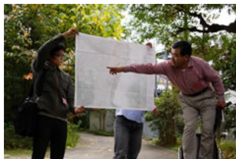
▲地図を示して活断層の説明